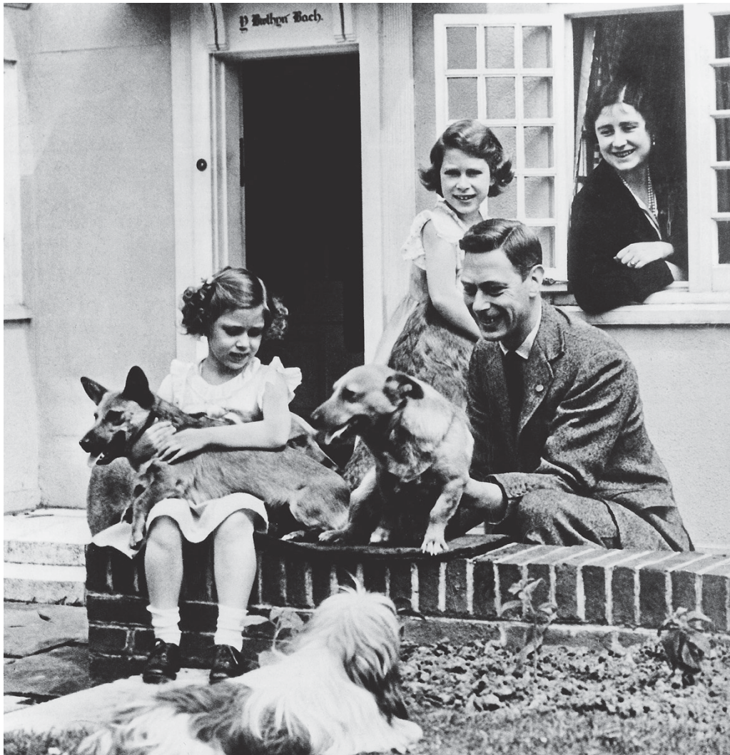
Elizabeth mit Margaret und den Eltern vor dem Miniaturhaus «Y Bwthyn Bach» («das kleine Haus»), einem Geschenk der Waliser an die königliche Familie, im Rose Garden der Royal Lodge, Windsor Great Park, Juni 1936

diese nicht mit Pferden und Pferdezucht zu tun hatten. In letzterem Ressort war sie eine weltweit anerkannte Expertin, für literarische Werke dagegen hatte sie nie die Nähe, das Interesse oder die Muße gefunden. Bennett, der diese Situation in einer Art Fantasmagorie umkehrt und aus Elizabeth eine «souveräne Leserin» macht (so die deutsche Übersetzung des Titels), impliziert ganz leise auch die latente Arroganz der Intelligenzia, die sich gerne daran rieb, dass die Monarchin nicht so war, wie die gebildeten Schichten sie gerne gehabt hätten.