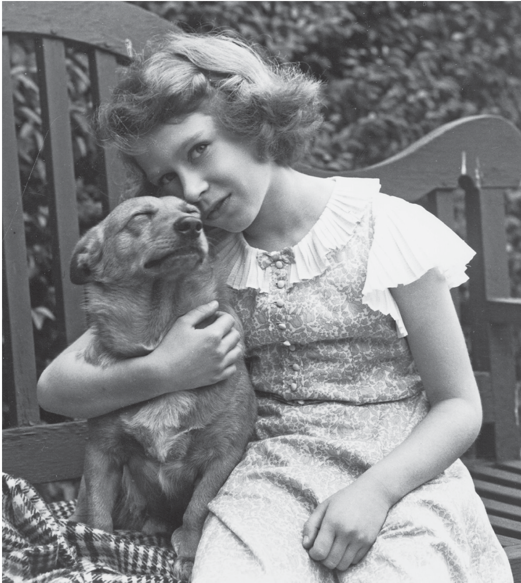
Corgi and Bess: Die zehnjährige Prinzessin Elizabeth mit Hund im Garten von 145 Piccadilly, Juli 1936

verknüpft – oder verwirrt? – waren, was den Grund gelegt haben muss zu der Scheu und der tastenden Vorsicht, die man der Queen nachsagte. Sie war nie eine Schauspielerin wie ihre temperamentvollere Schwester oder auch die Mutter, die einen ausgeprägten Sinn für Theatralik besaß. Alles war für sie eine ernste Performance mit verpflichtenden Regeln. Das musste man lernen und über sich ergehen lassen, aber im Gegensatz zu ihrem Onkel David, dem späteren Edward VIII., lehnte sie sich, wie wir noch sehen werden, nicht dagegen auf.